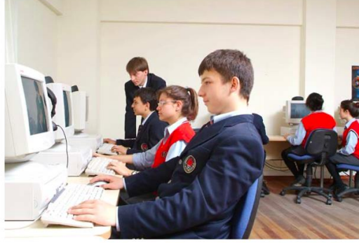
Güvenli Bilgisayar ve İnternet Kullanımı